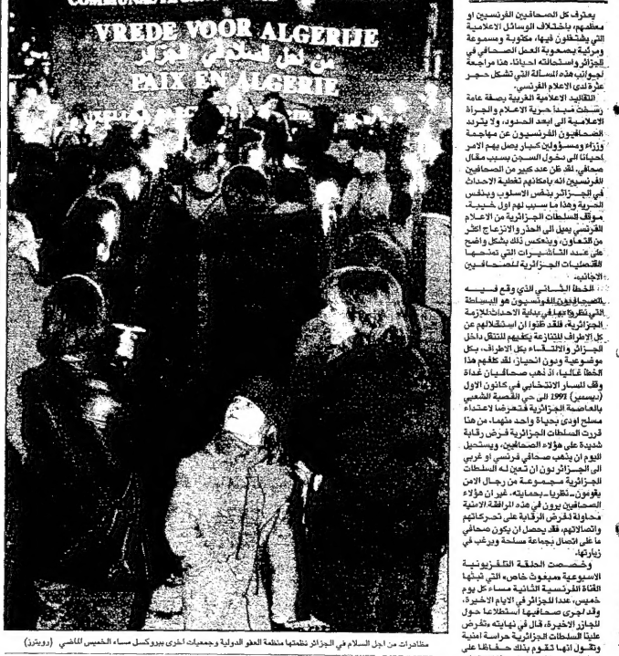
مزارعون من جبل السلام في الجزائر يتظاهرون بملف الطورانية ومجمعات اخرى بسلا، سعيد الخليل (رويت)